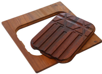
PLANCHE DE DECOUPE DOUBLE IROKO