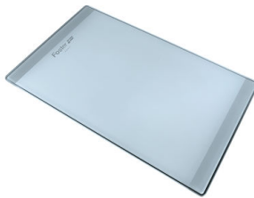
PLANCHE DE DECOUPE CRYSTAL 23x41 CM

* uniquement en combinaison avec l'accessoire A644 F04